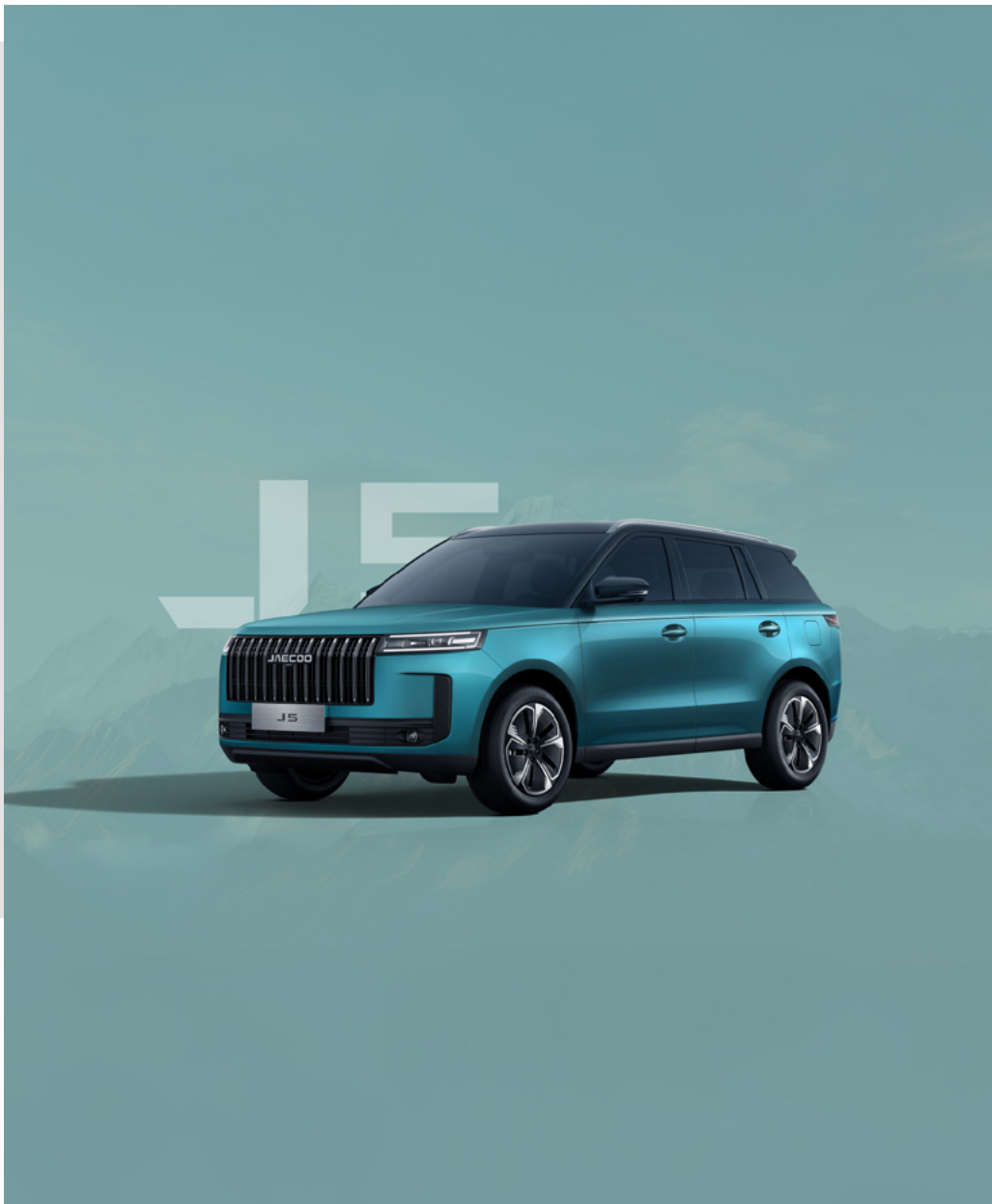
EUCALYPTUS GREEN Z CZARNYM DACHEM (Z6)