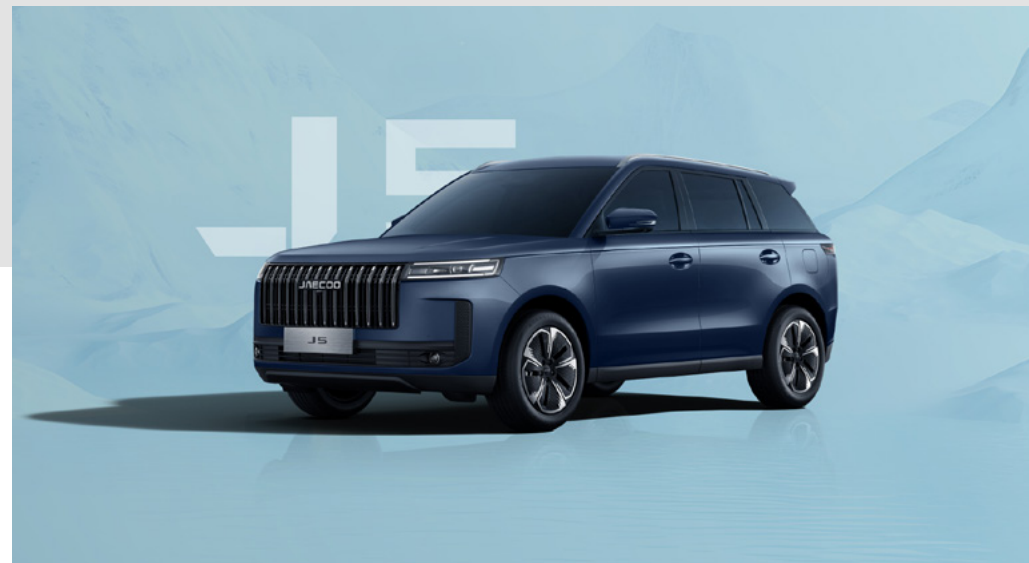
GLACIER BLUE (WS)