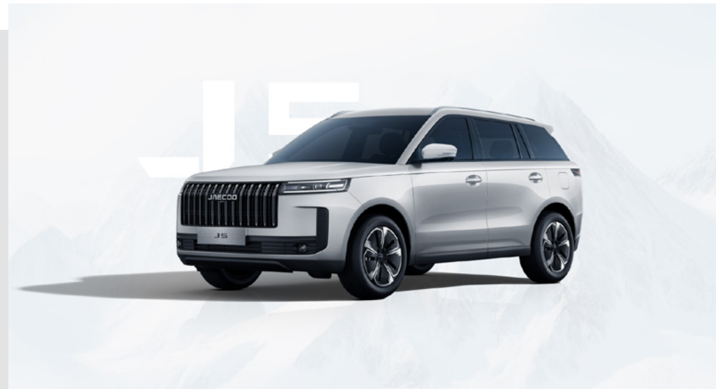
SNOW WHITE (BW)